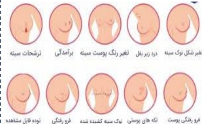
تغییر شکل نوک سینه درد زیر بغل تغییر رنگ پوست سینه برآمدگی ترشحات سینه

نکته ای که در مورد سرطان پستان ارثی وجود دارد آن است که احتمال ابتلا به آن در زنان بسیار بیشتر است. با اینکه نمی توان ادعا کرد که مردان به آن مبتلا نمی شوند، با این حال، بروز این بیماری در زنان به قدری بالاتر است که آن را عملاً یک بیماری زنانه می دانیم.